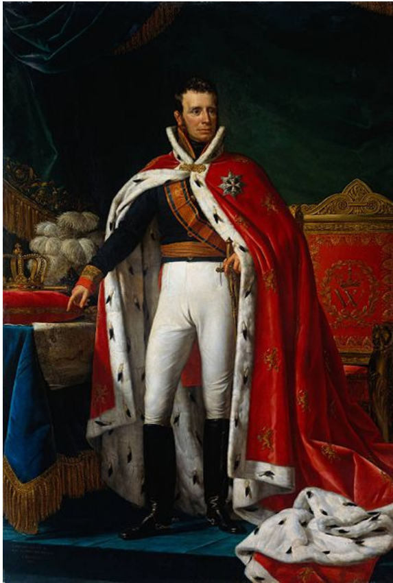
König Wilhelm I. von Holland 1772-1843 Initiator des ersten verzeichneten Investmentfonds